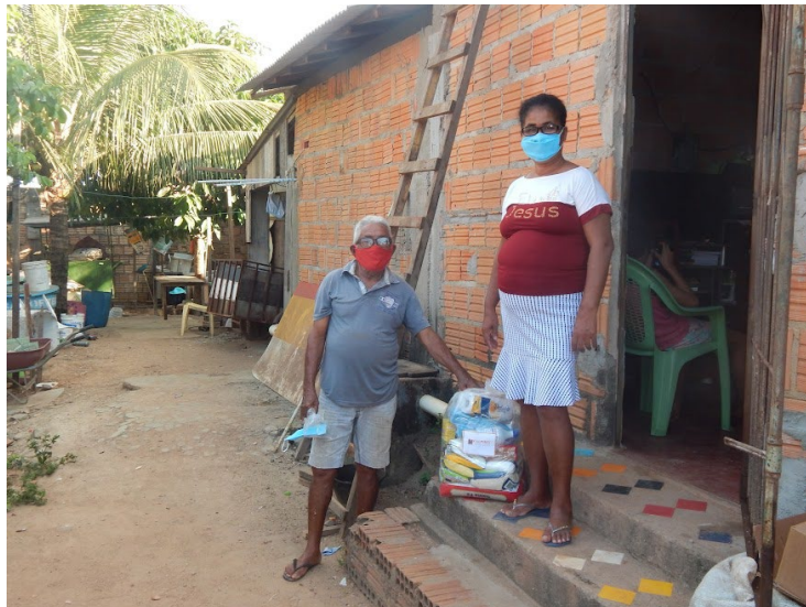
Menschen, denen das Programm zugutekommt