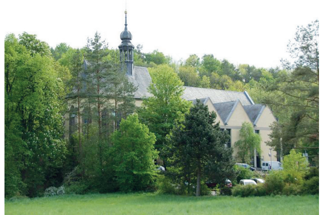
Die Wallfahrtskirche in Retzbach

Eine Einladung mit weiteren Informationen und der gewohnten Anmeldung wird rechtzeitig verschickt. Voller Vorfreude auf viele tolle Begegnungen grüßt euch euer KOLPING Arbeitskreis FRAUEN