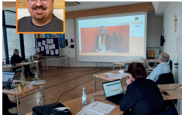
Die Delegierten des KW DV Würzburg wählten sich aus dem Kolping-Center ein

neuen Leitbildes, das auf der Bundesversammlung 2022 beschlossen werden soll. Die Zustimmung der Delegierten fand auch eine Erklärung zum Synodalen Weg. Der Verband will sich bis zur nächsten Bundesversammlung intensiv mit der „Geschlechtergerechtigkeit im Kolpingwerk Deutschland“ auseinandersetzen. Eine entsprechende Erklärung nahm die Versammlung zur Kenntnis.