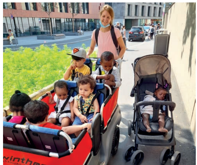
So machen Ausflüge Spaß