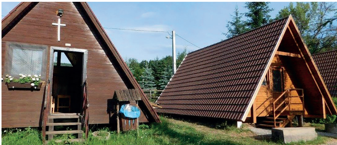
Beispiel eines alten und neuen Häuschens